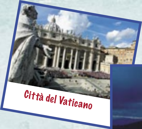
Città del Vaticano