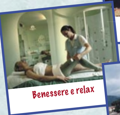
Benessere e relax