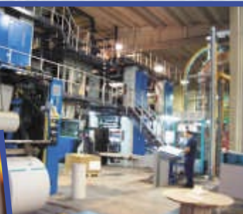
Il giornale più antico