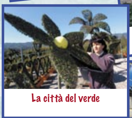
La città del verde